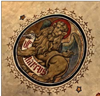
Ausschnitte aus dem »Himmel«, unter anderem der Evangelist Markus (rechts)